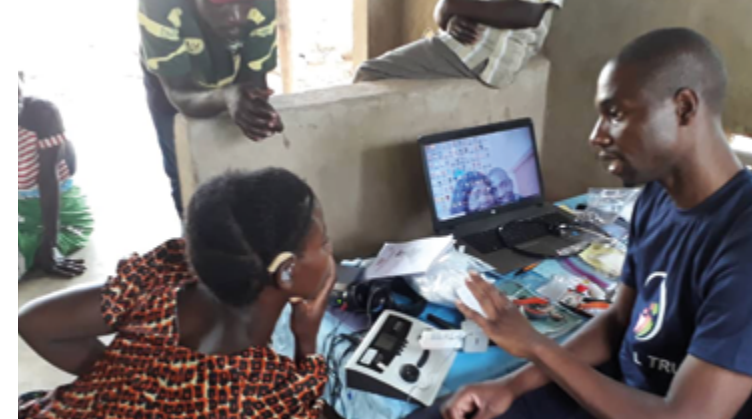
Mit einfachsten Mitteln kann geholfen werden, wie hier in Sambia. Wenn nach der Messung auch Hörgeräte vorhanden sind, noch mehr.