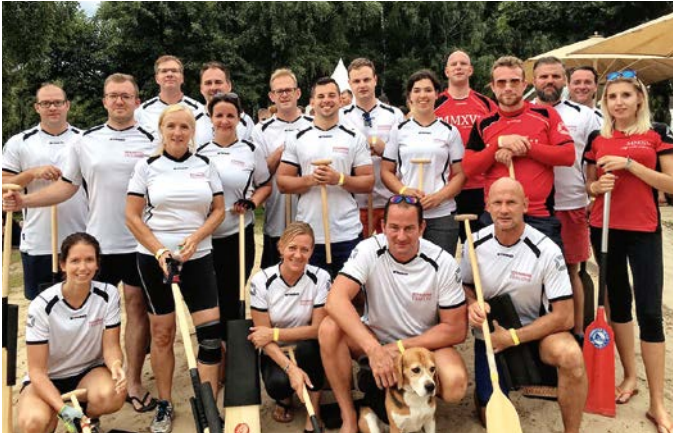
Paddler des Teams: