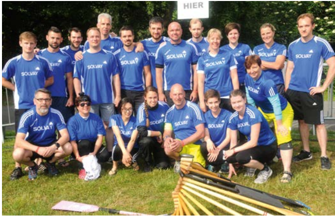
Paddler des Teams: